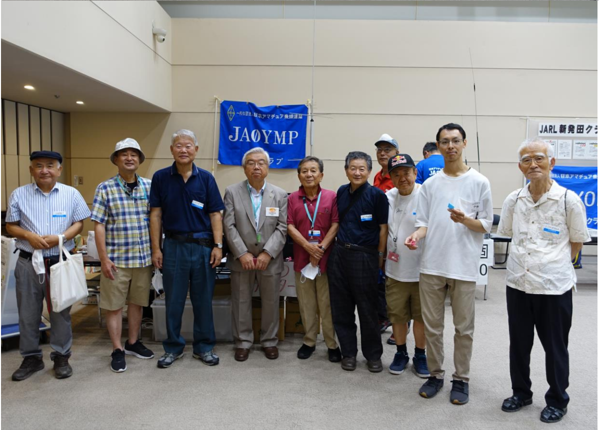
↑ 新津クラブ出席者 10 人全員記念写真