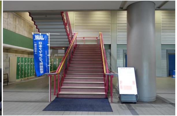
7月14日(日) JFODTN 局会議室・出展前準備打合せ