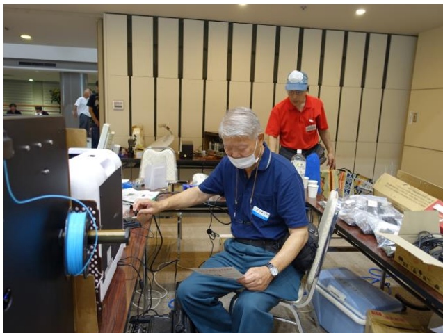
JH0OPR CW 模範電鍵操作