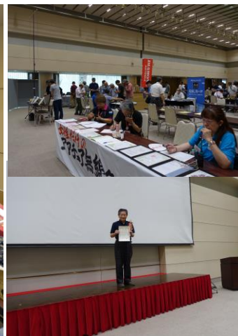
↑ 女性だけのアマ無線無線 C