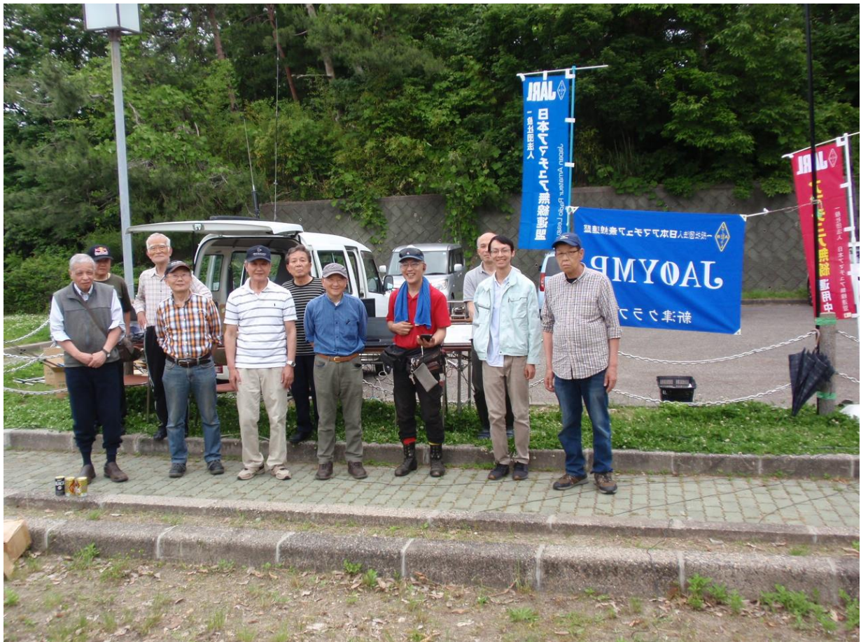
終了後の集合写真