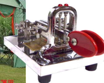
2016年6月5日 新津クラブ移動運用

こんにちは、JA0YMP・新津クラブです。私たちは、新津周辺のアマチュア無線愛好家を中心に、各イベントを楽しんでいます。